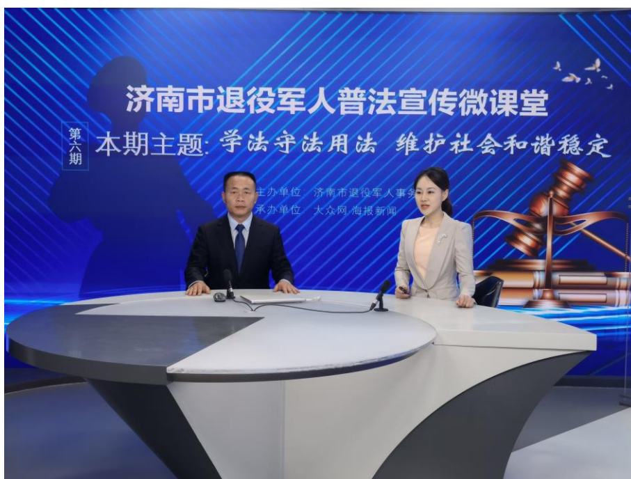
普法宣传活动现场

为更好发挥我市退役军人法律志愿服务队作用，用心用情用力做好普法宣传，11月23日下午，济南市退役军人事务局联合大众网·海报新闻，通过网络直播的形式成功举办第6期“济南市退役军人普法宣传微课堂”。