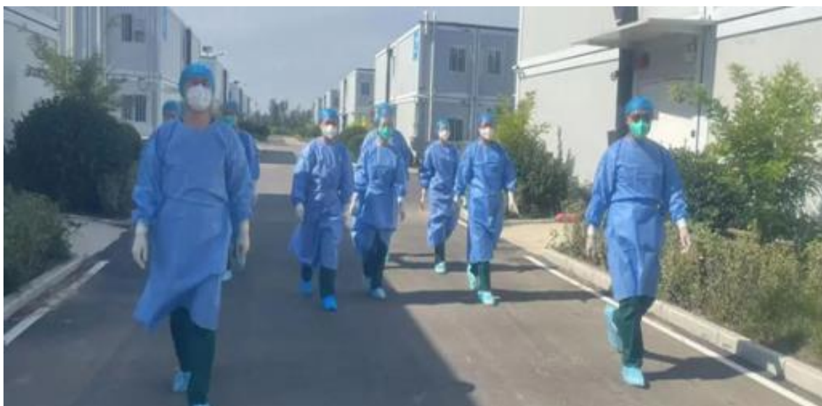
采样送检-“疫”线前沿的“担当者”

北园街道清河社区是全市大型家具市场集散地，人流量极大。为助力保障社区安全，清河社区组织退役士兵专项公益岗组成志愿服务队。