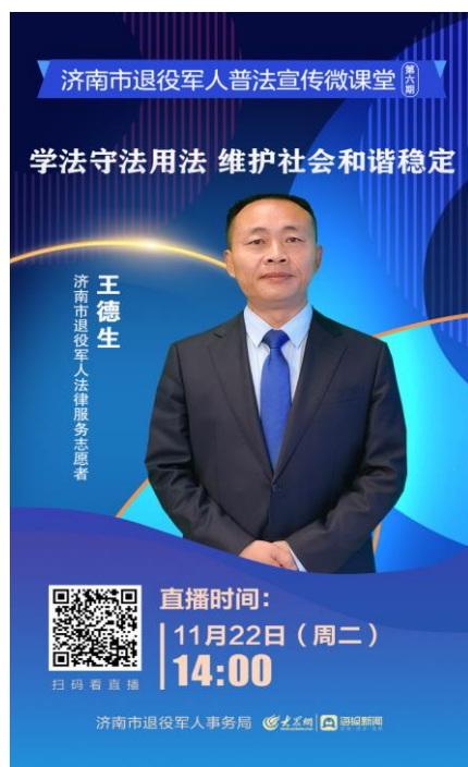
直播海报（支持扫码回看）

全市退役军人事务系统干部职工和退役军人累计观看 15.6 万余人次。下一步，市退役军人事务局将继续用好“普法宣传微课堂”这一平台，为广大退役军人普及相关的法律法规，不断增强法律意识和提高风险防范能力，更好维护自身的合法权益。